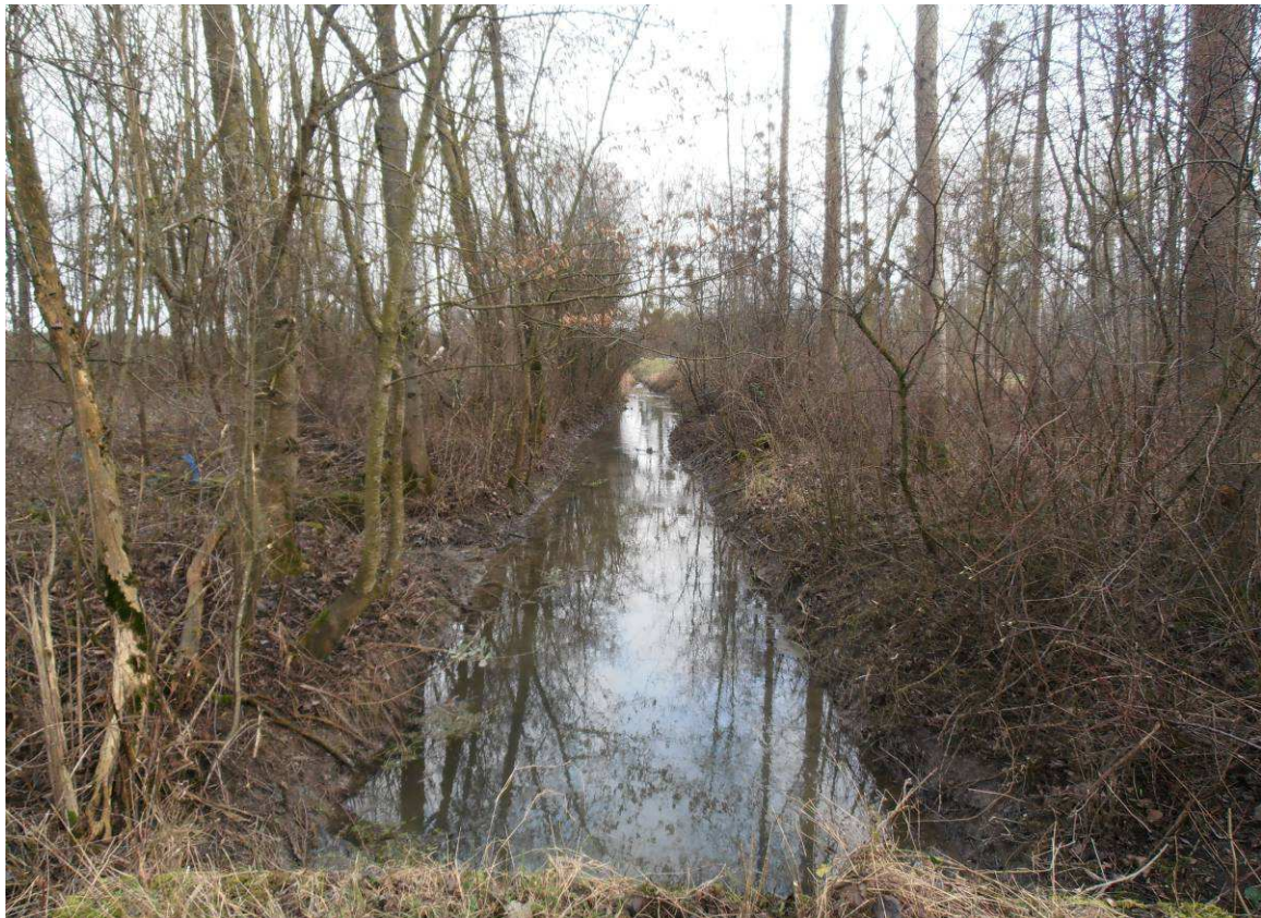
Dégagement de la végétation recouvrant le lit de la rivière et maintien d'une végétation en bordure.