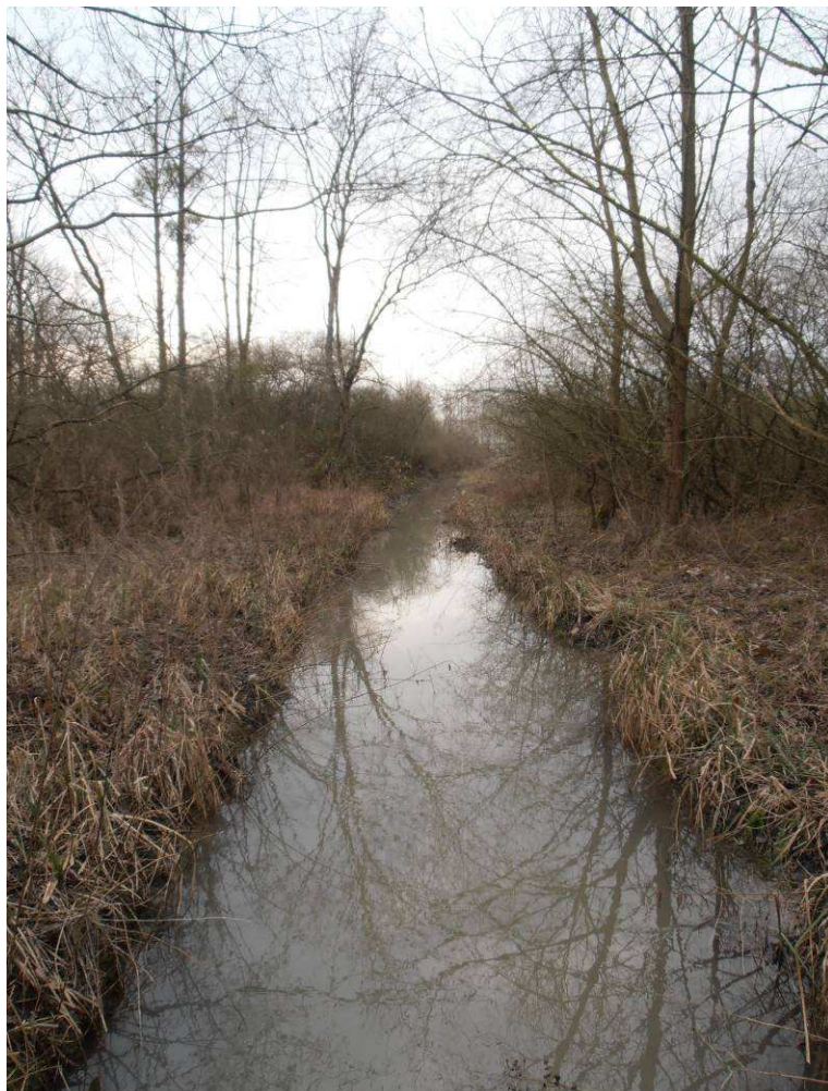
Dégagement du lit par coupe de la végétation buissonnante.