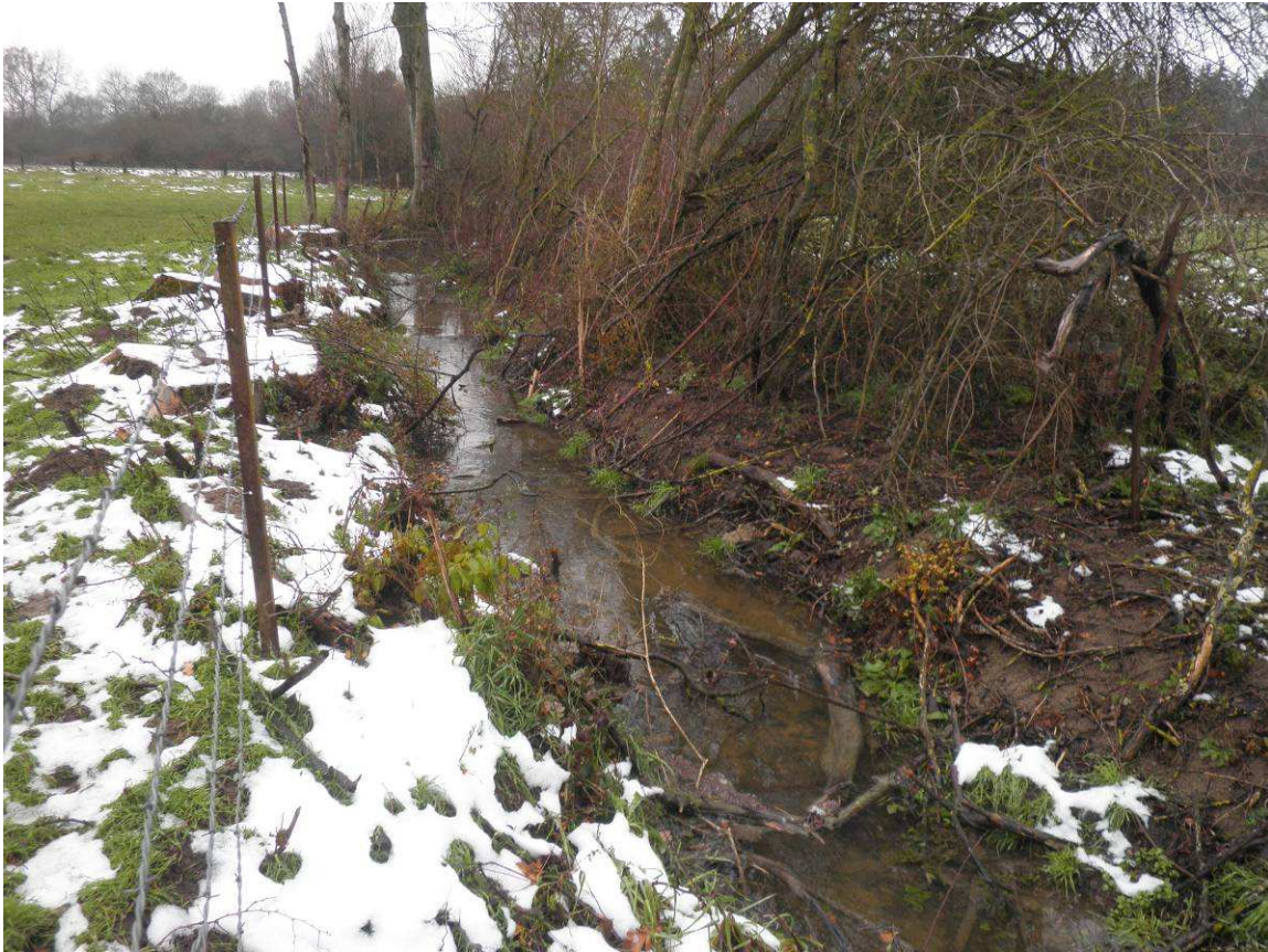
Présence de légers encombres dans le lit de la rivière.