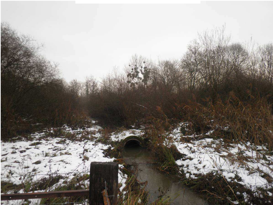
Vue opposée : saule buissonnant fortement développé sur le lit de la rivière.