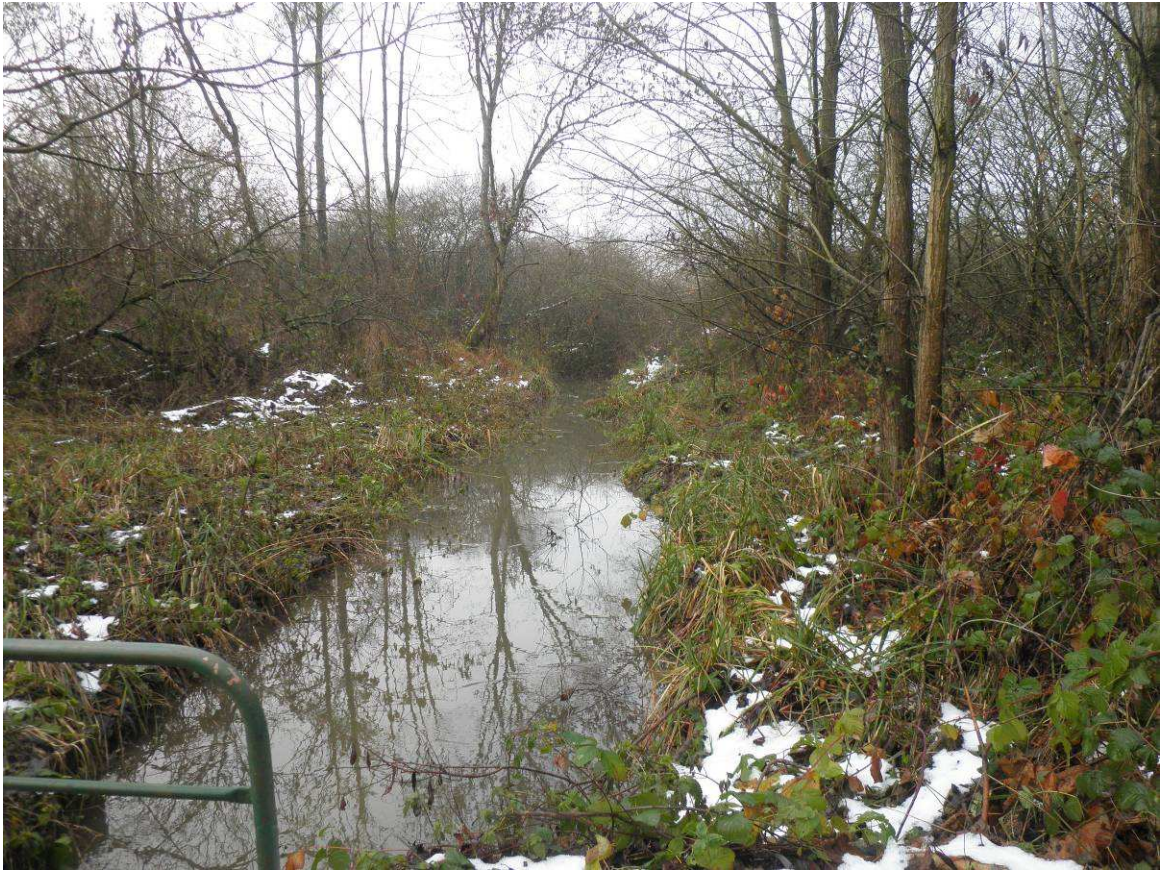
Saule buissonnant recouvrant entièrement le lit de la rivière.