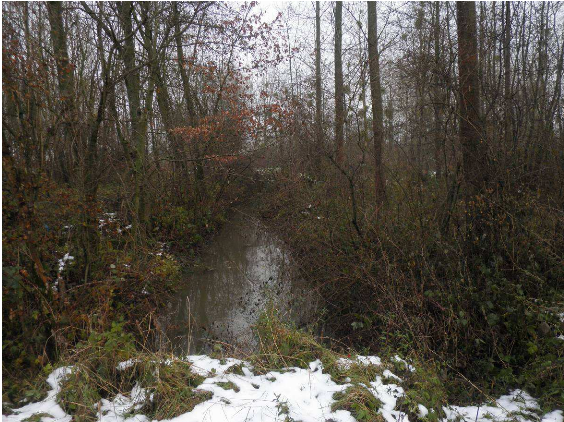
Limite aval de l'ASA, encombrement par une végétation buissonnante.