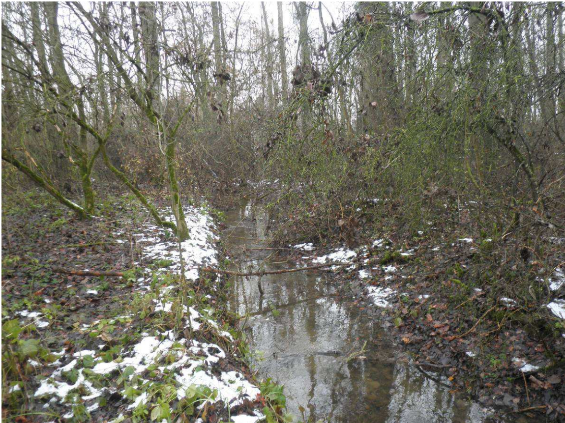
Encombrement du lit de la rivière par une végétation buissonnante.