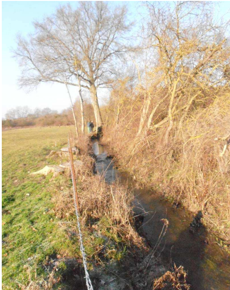
Extraction des encombres et coupe des brins retombant dans la rivière.