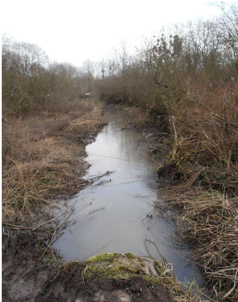
Coupe de réouverture du milieu.