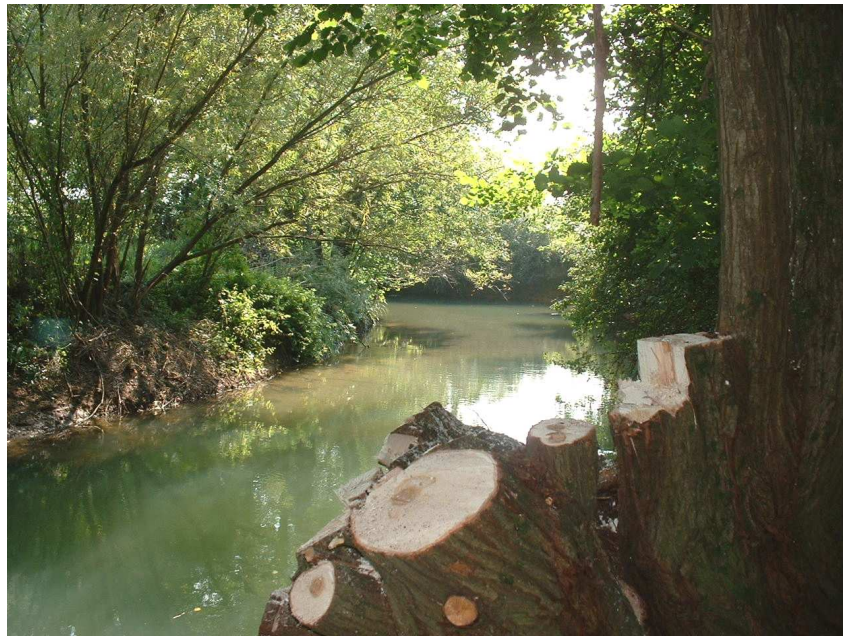
Sous villers sur Bar buissonnants et saules vieillissants