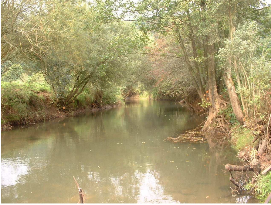
Après entretien aval pont omicourt