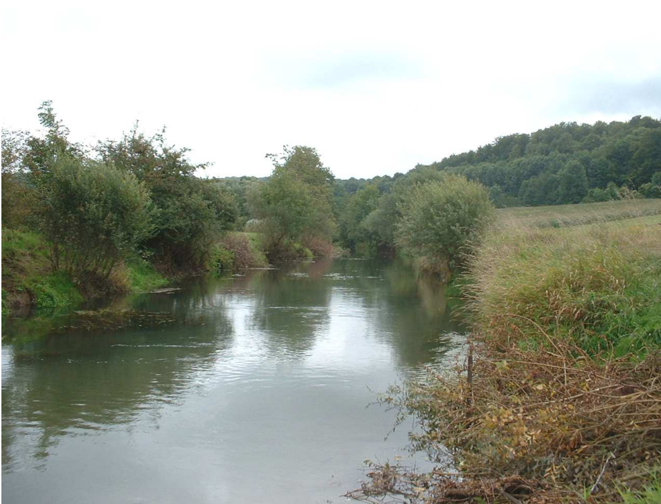
Amont de Chéhéry