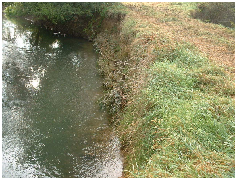
Réalisation d'un peigne sur berge érodée avec risque de coupure