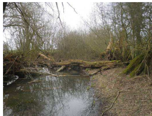
Extraction de la végétation encombrant le lit du bras. Observation d'un développement d'hélophytes lors de la visite de réception.