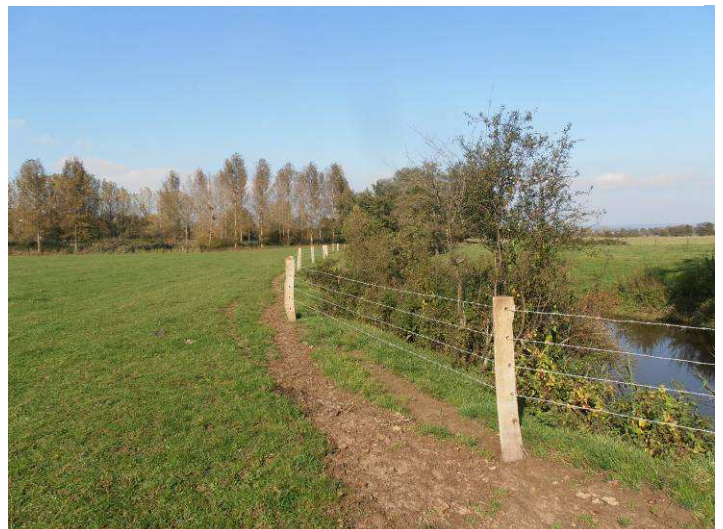
Secteur de Hannogne saint-Martin : installation d'une clôture barbelée 4 fils et plantations