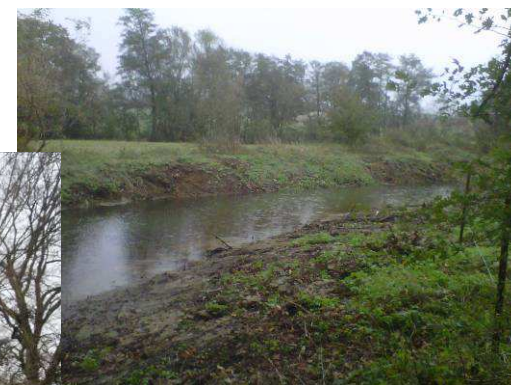
Coupe et extraction de toute végétation encombrant l'annexe