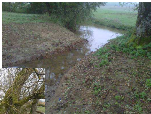
Zone de connexion de l'annexe avec la rivière Bar restaurée.