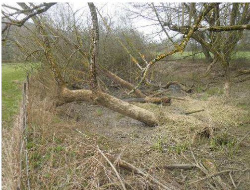
Amont de la zone de connexion : bras fortement encombré. Extraction de la végétation et talutage des berges pour faciliter l'apport de lumière et l'installation de végétation de type herbacée.