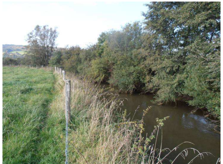
Secteur Omicourt-Chémery sur Bar: installation d'une clôture barbelée 4 fils et plantations