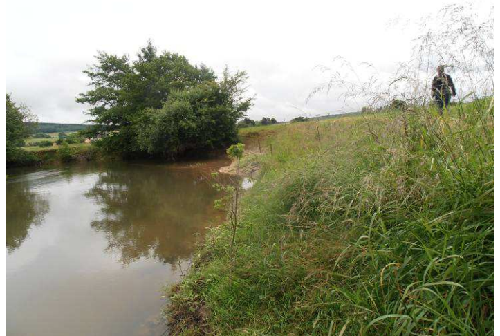
Secteur de Villers sur Bar : installation d'une clôture électrique et mise en place de plantations